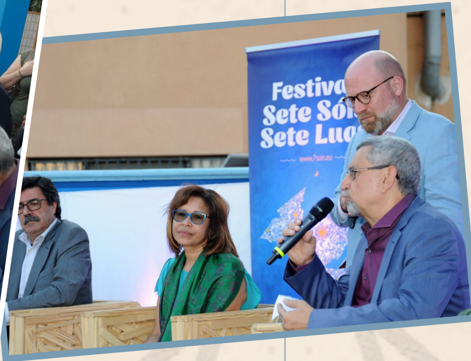
Inaugurazione dell'esposizione collettiva di artisti capoverdiani e concerto della Maio7LuasBand